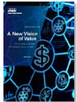
价值的新愿景：连结 企业和社会的价值创造