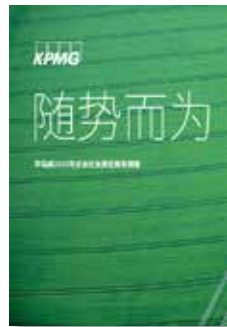
随势而为 - 毕马威 2015年企业社会 责任报告调查