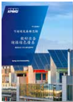
可持续发展新思维： 做好准备迎接绿色 债券