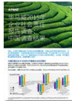
毕马威2015年企业 社会责任报告调查： 中国调查结果