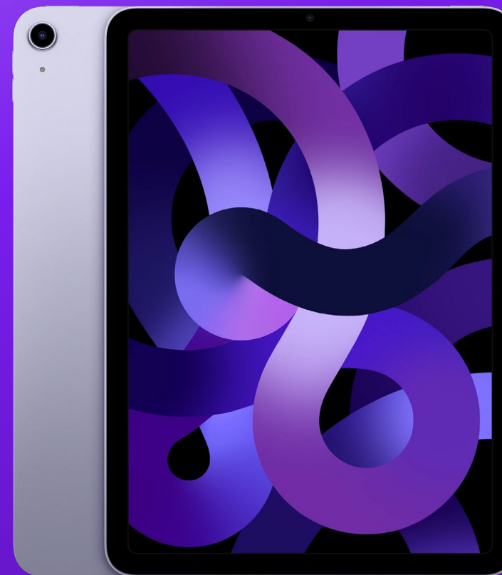
iPad Air 2022

А победитель в номинации «Цифровой Прорыв Года» также получит внешнее тестирование на проникновение от команды кибербезопасности и информационных рисков KPMG.