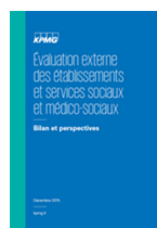
Evaluation externe des ESSMS (2015)