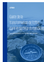
Guide de la transformation de l'offre d'accompagnement - Secteur du handicap (2020)