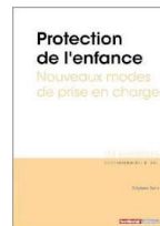
Protection de l'enfant - Nouveaux modes de prise en charge (2018)