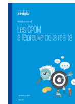
Les CPOM à l'épreuve de la réalité (2017)