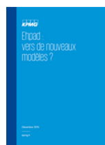
Ehpad : vers de nouveaux modèles (2015)