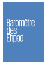
Baromètre des Ehpad (2021)