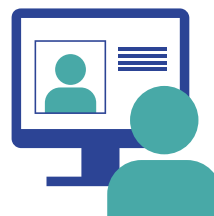
Managed Review Services Review elektronischer Dokumente durch geschulte Fachkräfte aus unserem KPMG-Netzwerk

Einsatz von künstlicher Intelligenz bei der Suche nach relevanten Dokumenten mit dem Ziel der Verkürzung von Review-Zeiten und gleichzeitiger Steigerung von Qualität und Sicherheit