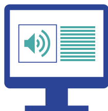
Künstliche Intelligenz und Technology Assisted Review (TAR)

Einsatz von künstlicher Intelligenz bei der Suche nach relevanten Dokumenten mit dem Ziel der Verkürzung von Review-Zeiten und gleichzeitiger Steigerung von Qualität und Sicherheit