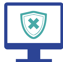
Exception Handling und Datenschutz Aufbereitung heterogener Datenmengen und datenschutzkonforme Datenverarbeitung