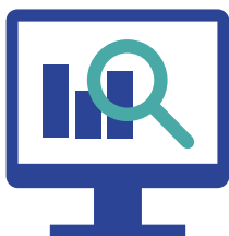
Early Case Assessment Ersteinschätzung und Bewertung des Falls