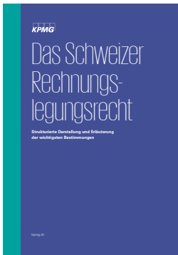
Das Schweizer Rechnungslegungsrecht Strukturierte Darstellung und Erläuterung der wichtigsten Bestimmungen